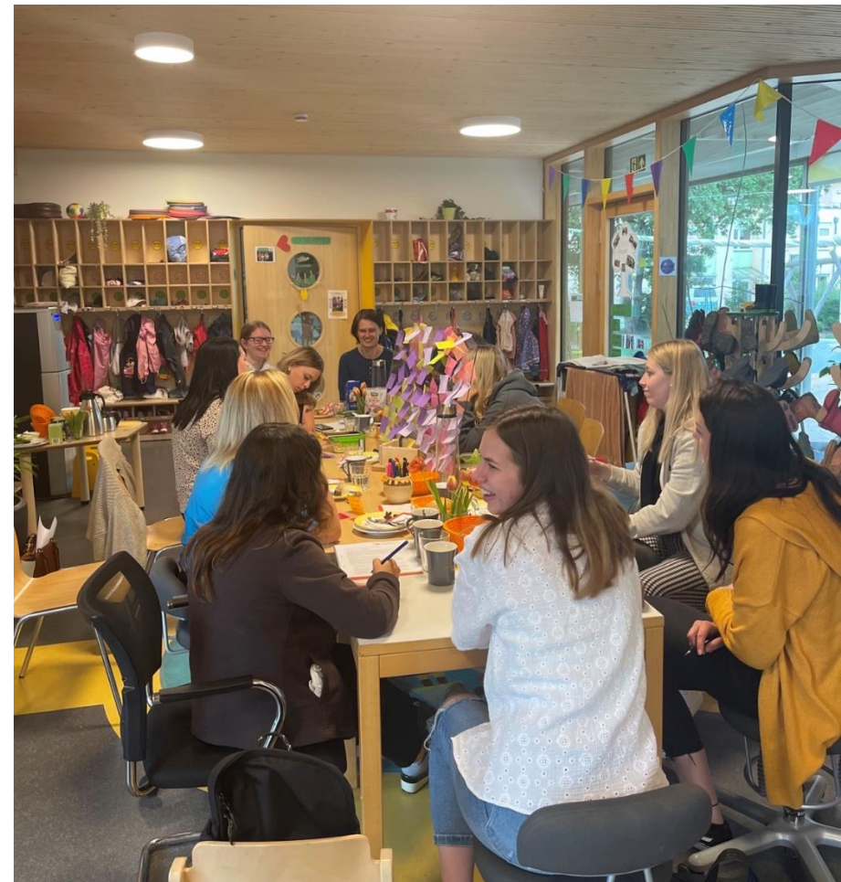
Planungstag im Mai 2022

Zusätzlich nimmt die Leitung regelmäßig an den Qualitätsmanagement Leitungssitzungen des Trägers teil. Zentrale Aufgabe des QM ist die Herstellung eines für die Häuser weitgehend einheitlichen Qualitätsprofils sowie die fachliche Weiterentwicklung aller Einrichtungen.