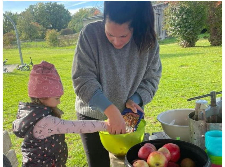
Vom Kern zum Apfelsaft