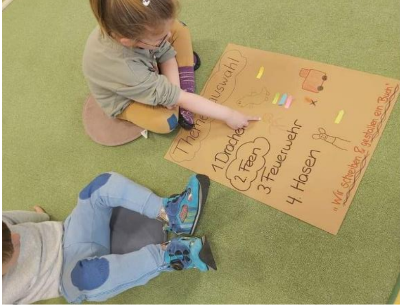
Selbst ein Buch schreiben